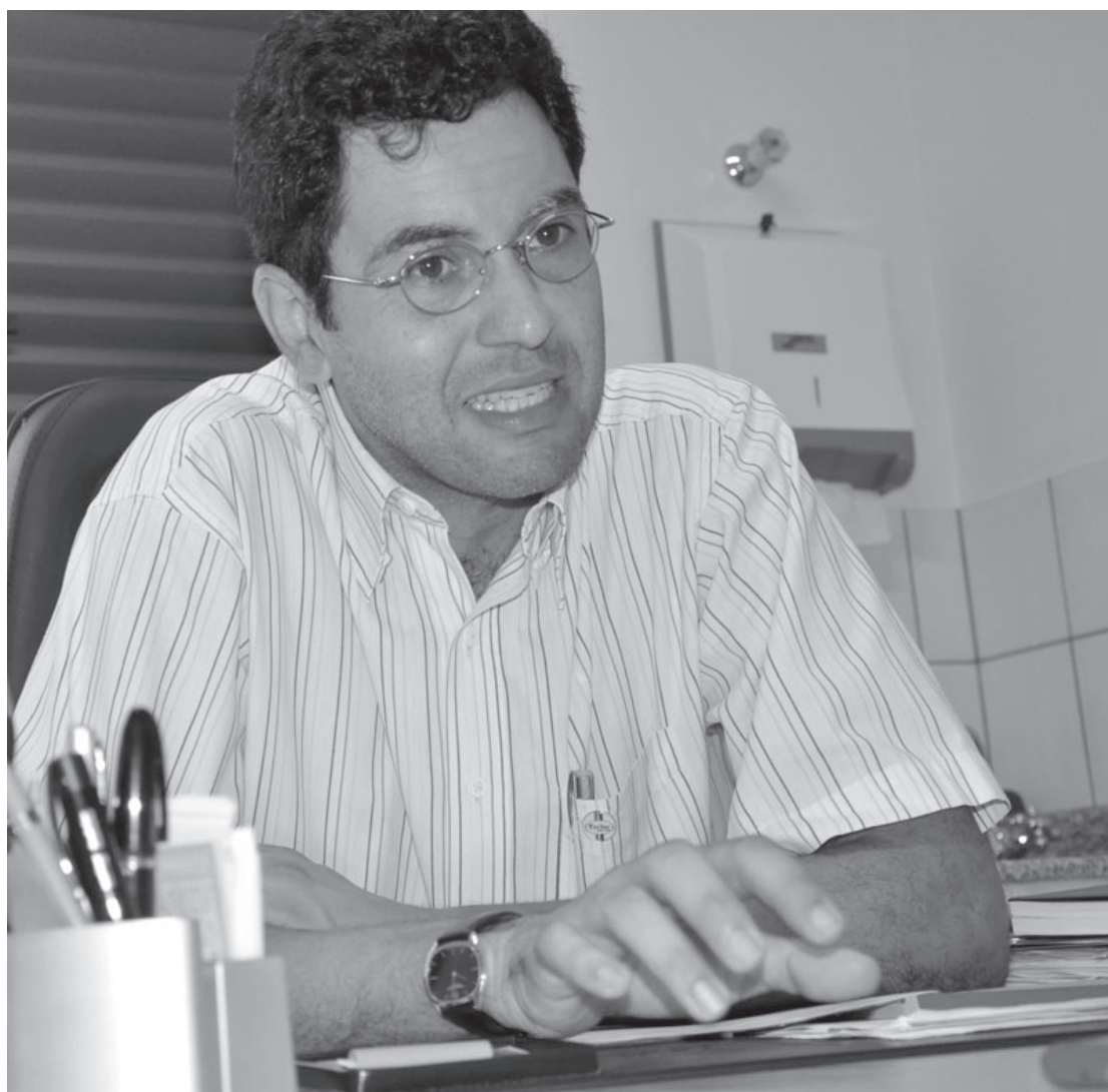
SAÚDE TEM 400 casos de portadores do HIV registrados, mas Daher diz que número de infectados chega a três mil

No município vem acontecendo exatamente o contrário já que novos pacientes estão sendo diagnosticados com frequência. “Existe o lado positivo para aquelas pessoas que recebem o diagnóstico mais