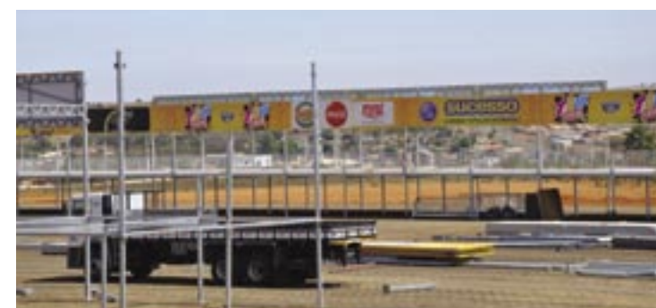
ACESSOS serão abertos para facilitar chegada dos veículos ao novo espaço

da e estão no mesmo patamar das grandes cidades. A receptividade é boa apesar de haver alguns casos isolados de pessoas e situações que impedem o trabalho do Instituto Brasileiro de Geografia e Estatística (IBGE). POLÍTICA, 5