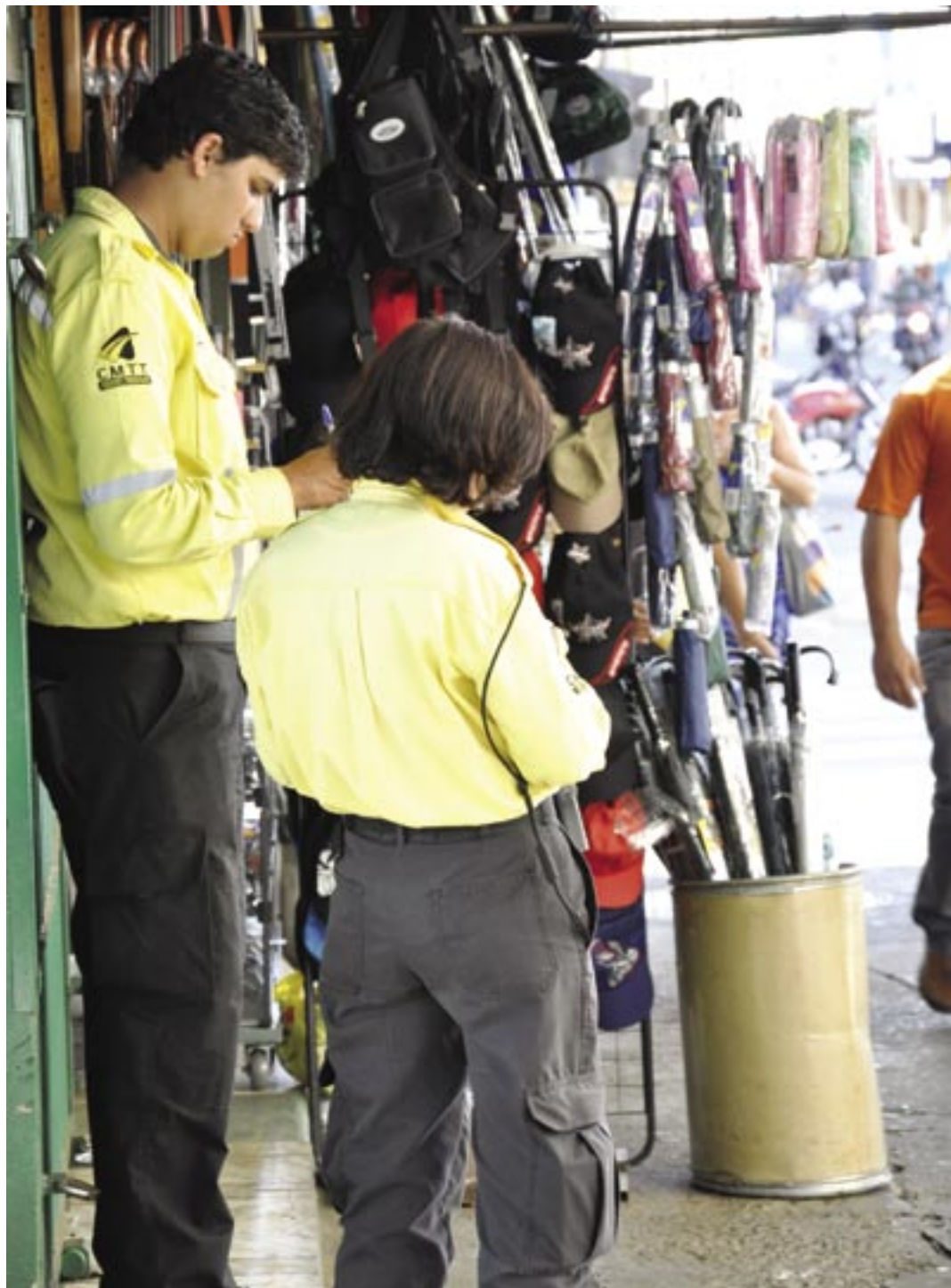
MOTORISTAS reclamam que os fiscais de trânsito abusam de uma arma poderosa: o bloco de auto de infração

A situação do Anápolis pode até estar complicada no Campeonato Goiano da Divisão de Acesso, mas uma coisa é certa: o time ainda depende apenas de si para chegar à próxima fase da competição. Neste domingo, às 16 horas, no Estádio Jaime Guerra, em Nerópolis, o Galo tenta algo que ainda não conseguiu no campeonato até agora: vencer fora de casa. Caso supere esse obstáculo segue na luta por um lugar na elite do futebol do Estado. Do contrário, dá adeus ao sonho. ESPORTES, 3B