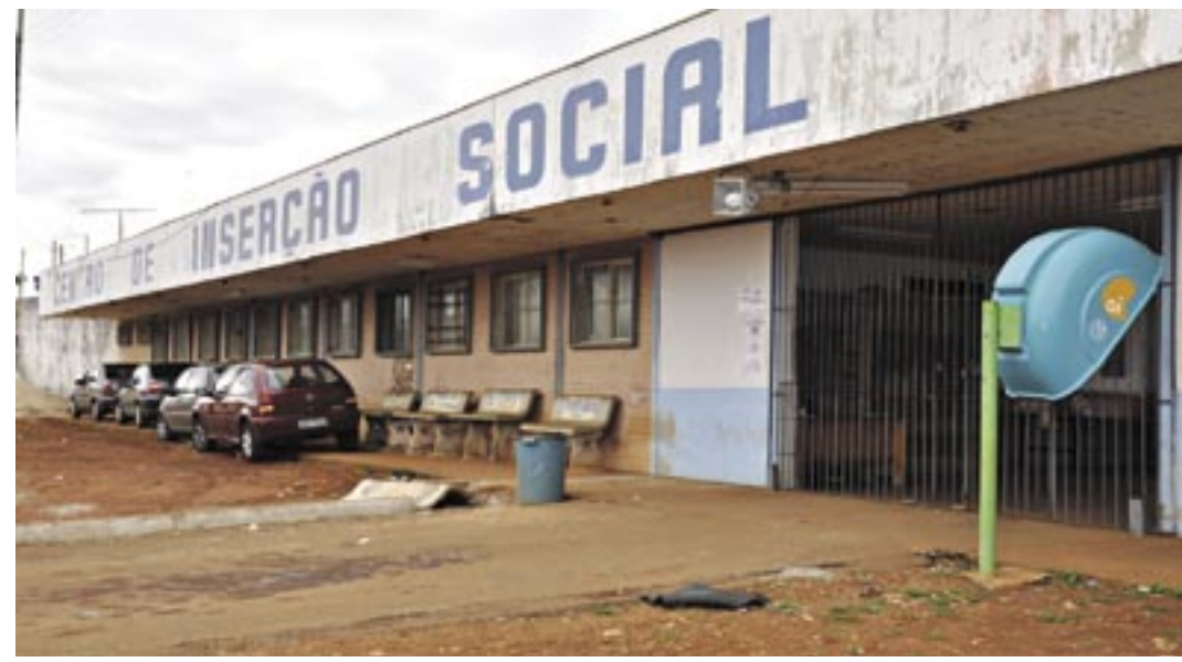
PARA amenizar o caos da superlotação, a Justiça determinou o encaminhamento de mulheres para outras cidades

classe empresarial serão priorizados. O carro-chefe das discussões, adianta Ubiratan, é a busca pelo comprometimento de todos em buscar solução para viabilizar projetos de importância para a cidade. Entre eles o presidente da Acia cita a Plataforma Logística, o aeroporto de cargas e a expansão do Daia. "Queremos o compromisso formal de cada um em relação a esses nossos pleitos", explica. POLÍTICA, 4