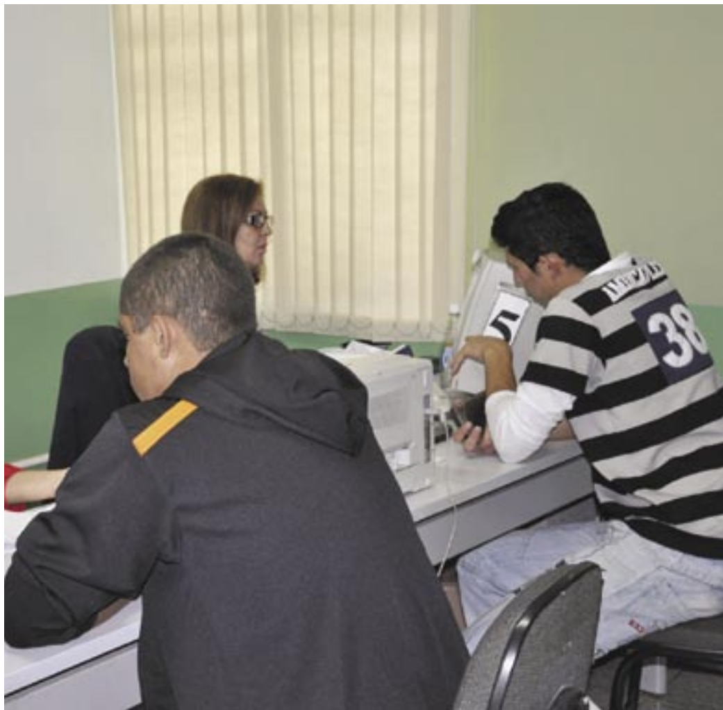
DE ACORDO com o Sine, que faz cadastro de trabalhadores, maior carência é no setor de prestação de serviços