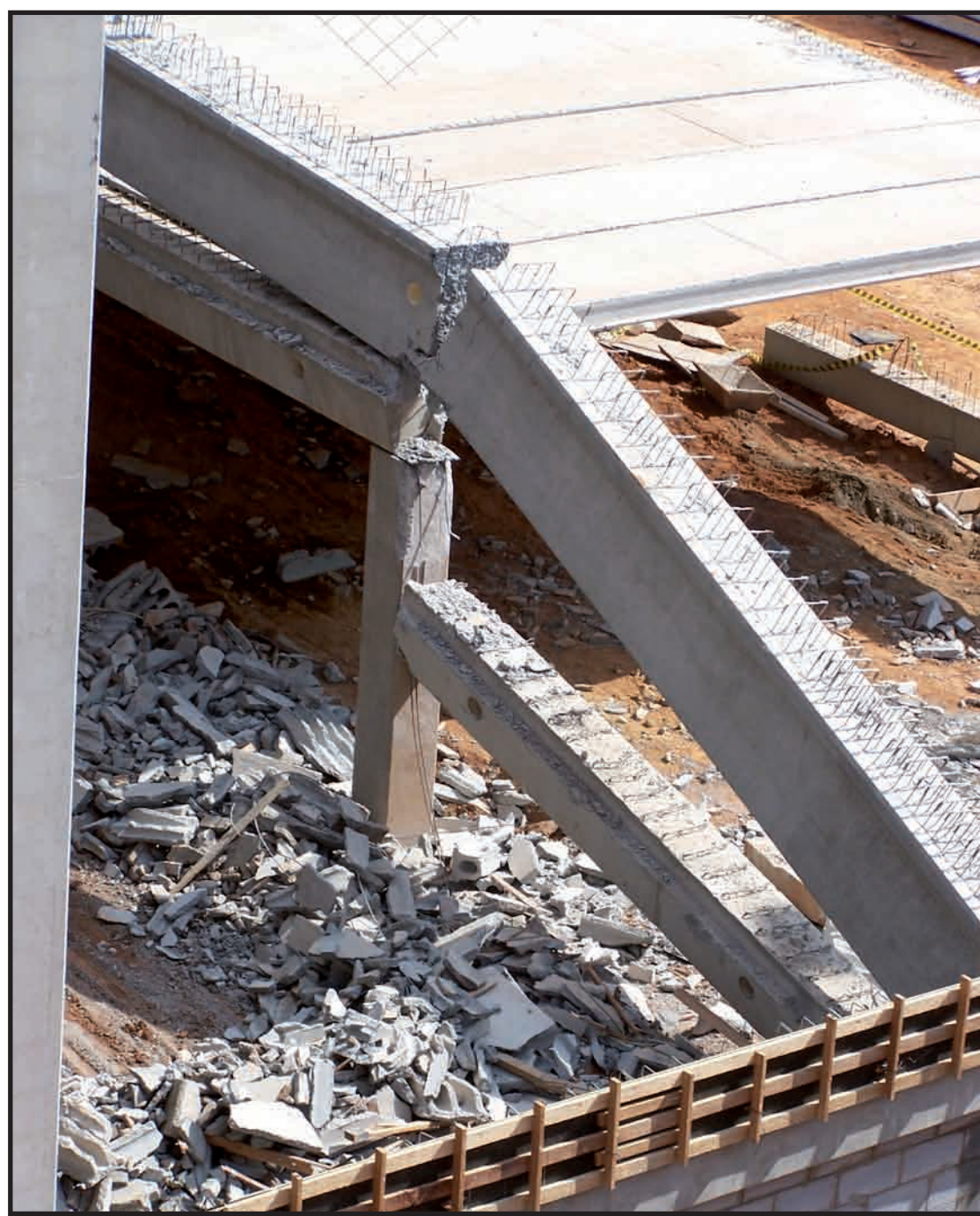
LOCAL DA TRAGÉDIA: guindaste pode ter "esbarrado" em viga, mas confirmação somente depois de resultado da perícia

rários, deixando outros três feridos gravemente. Segundo a assessoria de imprensa da empresa, a construção vai permanecer interdita, ainda por prazo indeterminado. O Corpo de Bombeiros alertou para o risco de outro desabamento na obra e recomendou que os trabalhos fossem paralisados até a conclusão do laudo técnico. A Orca descartou a possibilidade de atraso na entrega do hipermercado, que está prevista para novembro deste ano. O Carrefour não quis se manifestar sobre o ocorrido.